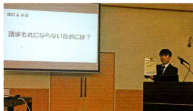
保険についてのセミナーも開催。